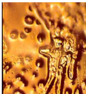
I hate you

Hình dạng tinh thể nước khi tiếp xúc với các thông điệp cảm xúc khác nhau. Thông điệp từ trái sang phải: “yêu thương”, “cảm ơn” và “tao hận mày”. Qua đó cho thấy sức mạnh của ý niệm của con người có thể điều khiển mọi vật. Gọi là: “dụng tâm khiển vật”.